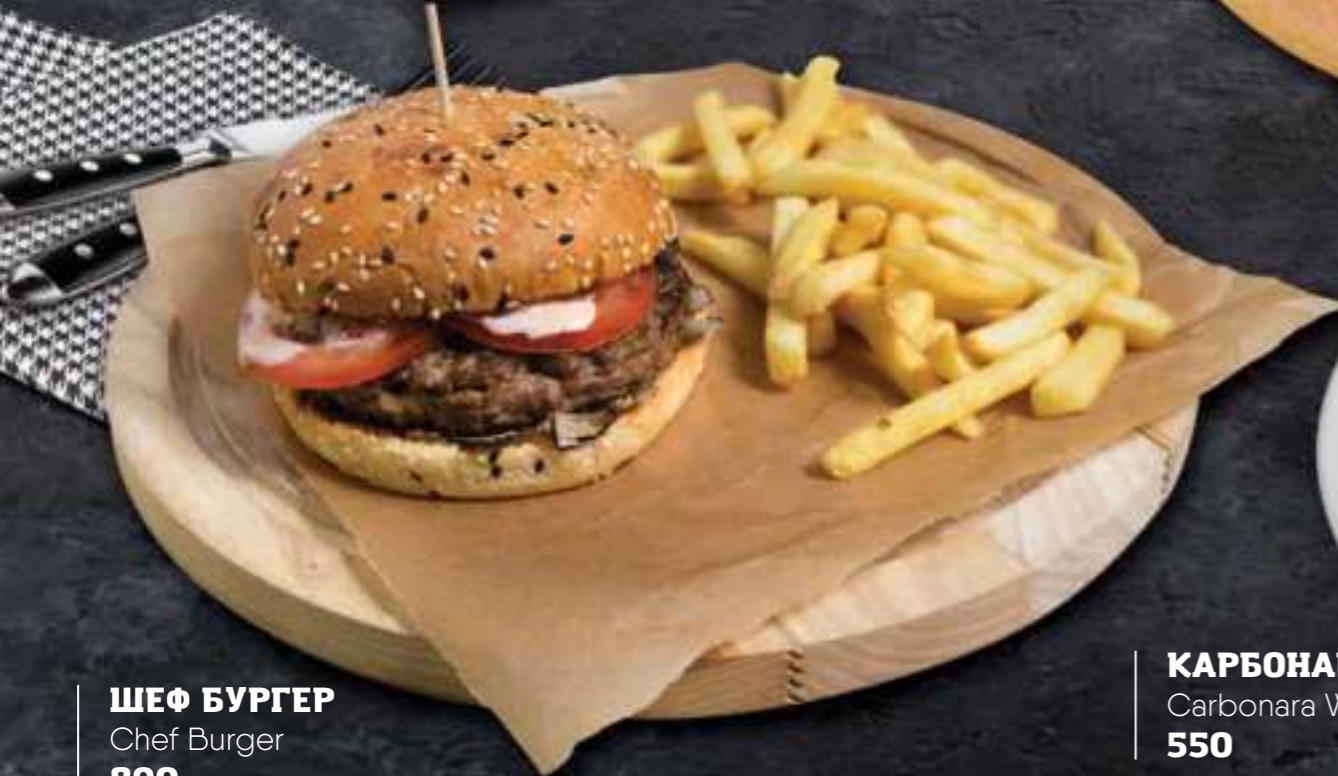
ШЕФ БУРГЕР Chef Burger 890