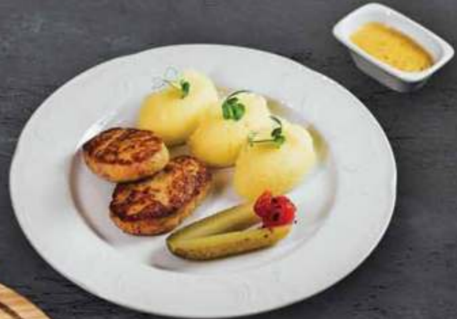
ДОМАШНИЕ КОТЛЕТЫ Chicken And Turkey Cutlets 650