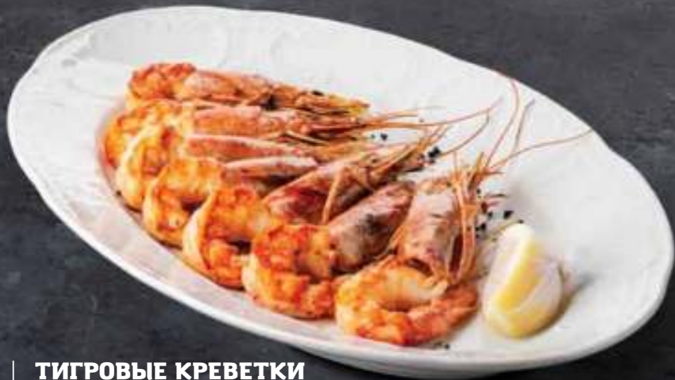
ТИГРОВЫЕ КРЕВЕТКИ НА ГРИЛЕ Tiger prawns on the grill 400