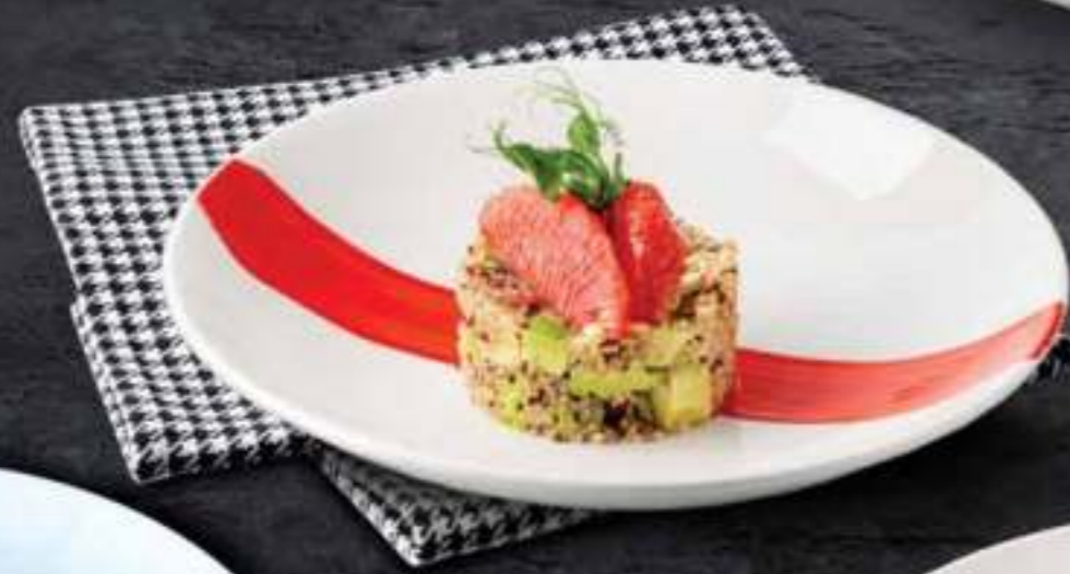
САЛАТ ИЗ КИНОА Quinoa Salad 480