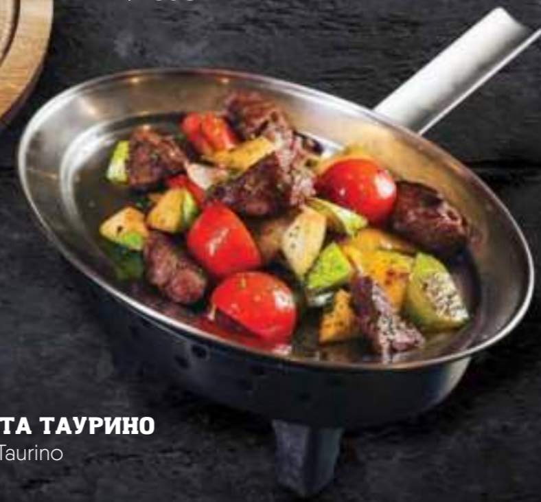
ФИЕСТА ТАУРИНО Fiesta Taurino 1150