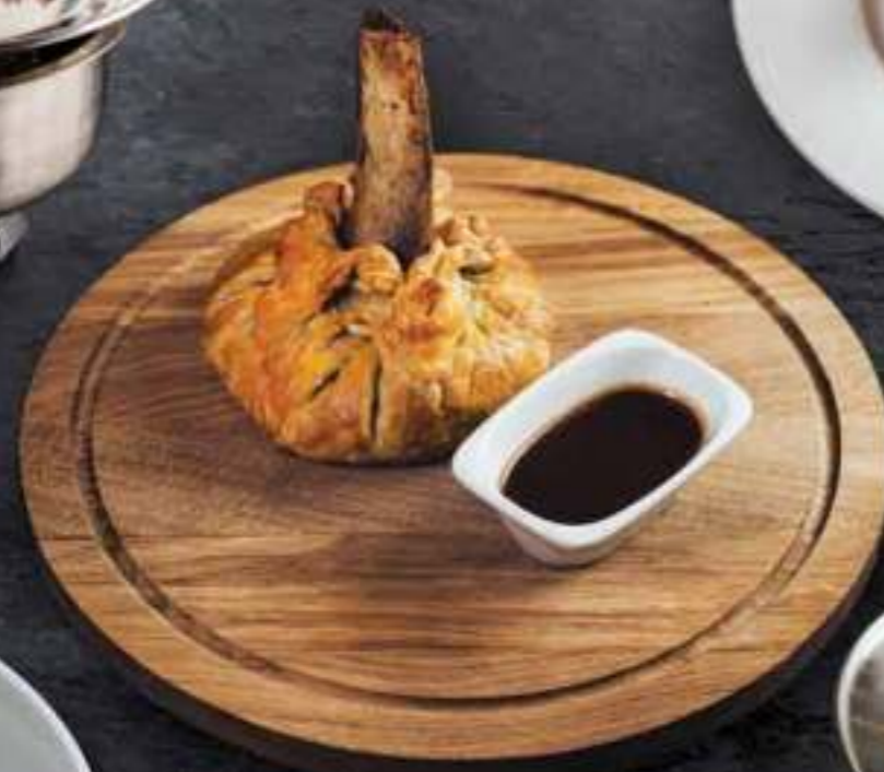
ПИРОГ МЯСНИКА Butcher's pie 950