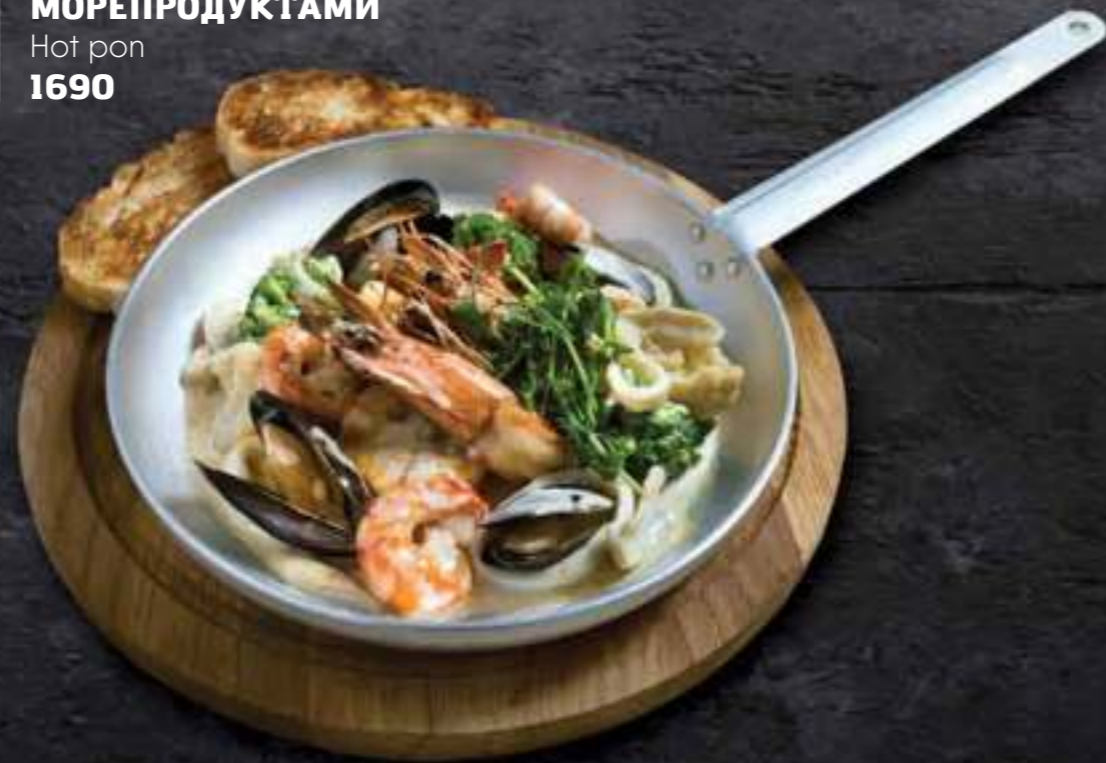
СКОВОРОДА С МОРЕПРОДУКТАМИ Hot pan 1690