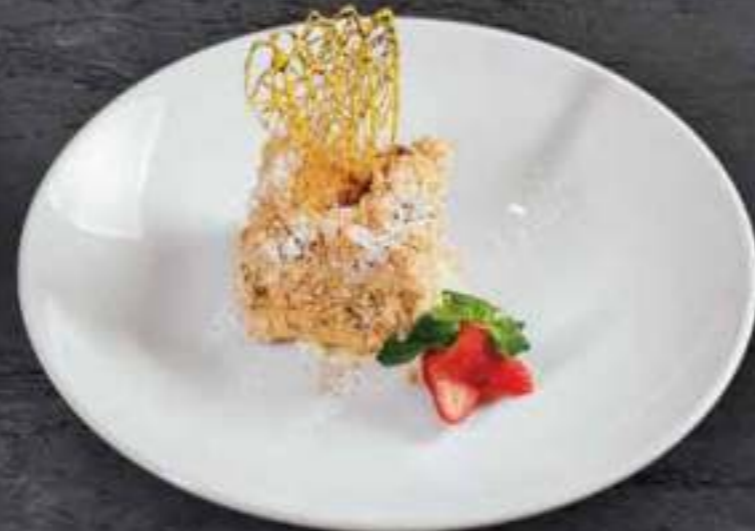
НАПОЛЕОН Napoleon 400