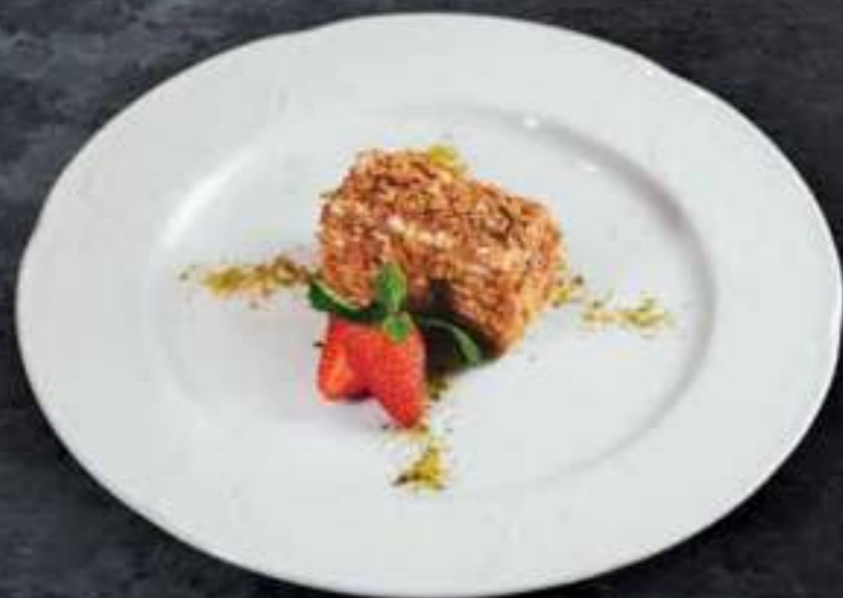
МЕДОВИК Honey Cake 400