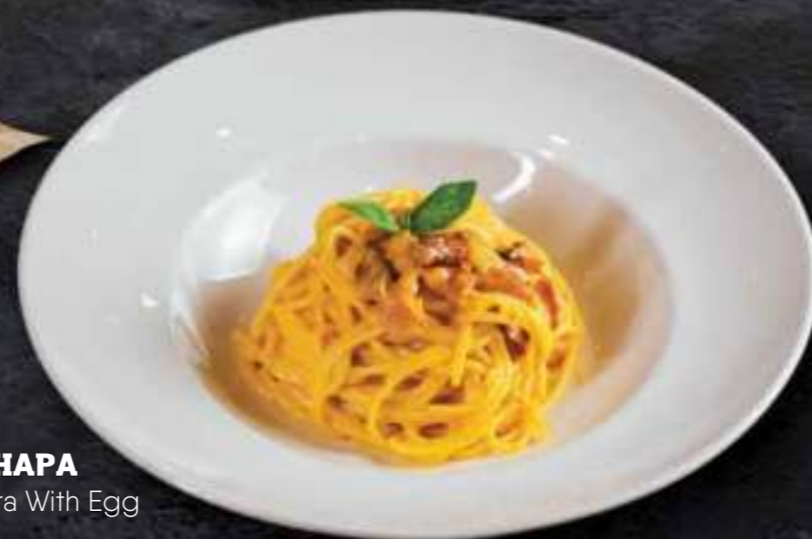
КАРБОНАРА Carbonara With Egg 550