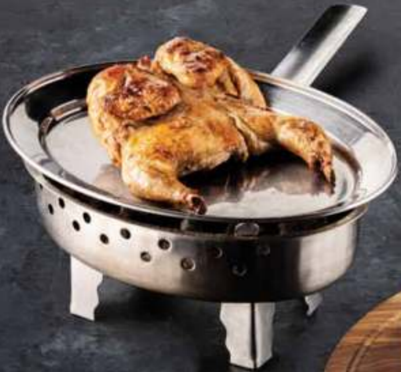
ЦЫПЛЁНОК НА ГРИЛЕ Grilled Farm Chicken 780