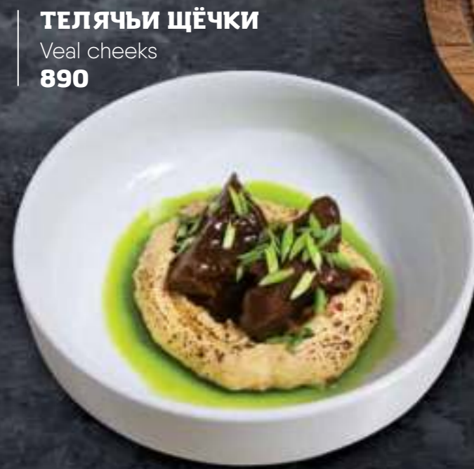
ТЕЛЯЧЬИ ЩЁЧКИ Veal cheeks 890