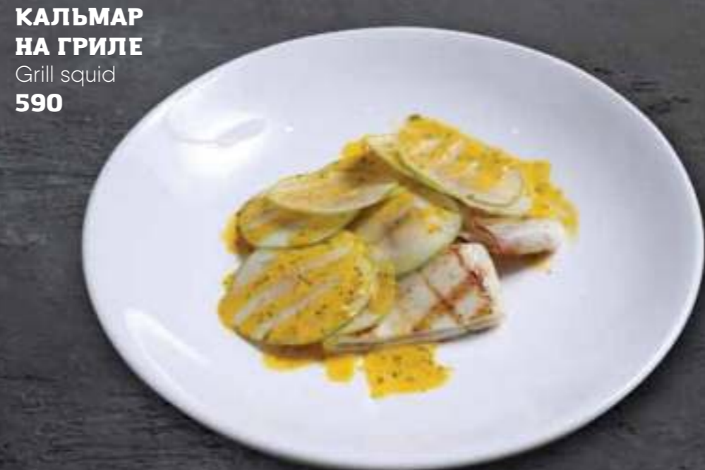
КАЛЬМАР НА ГРИЛЕ Grill squid 590