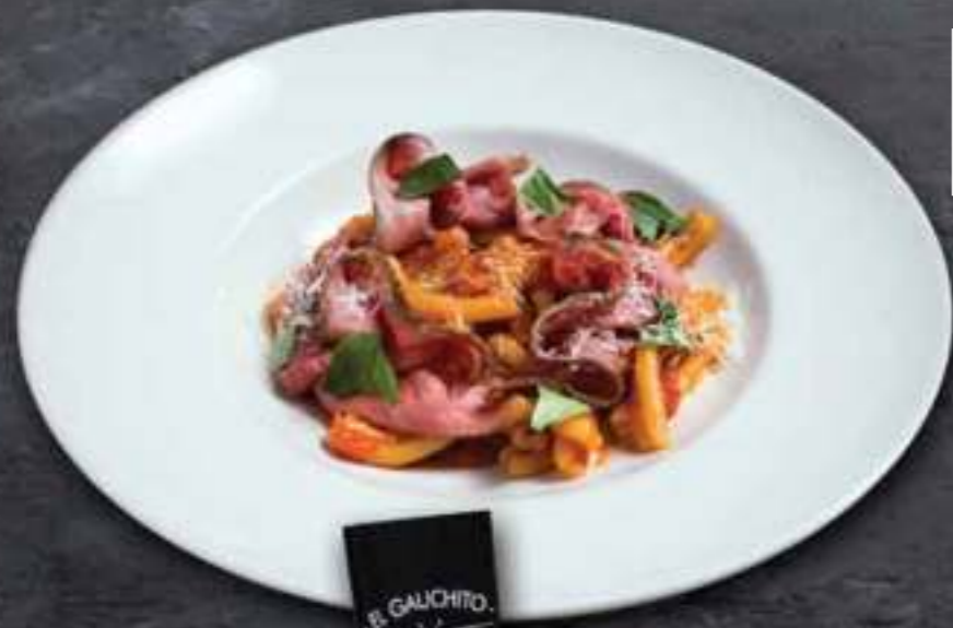
АРАБЬЯТА С РОСТБИФОМ Arabiata 620