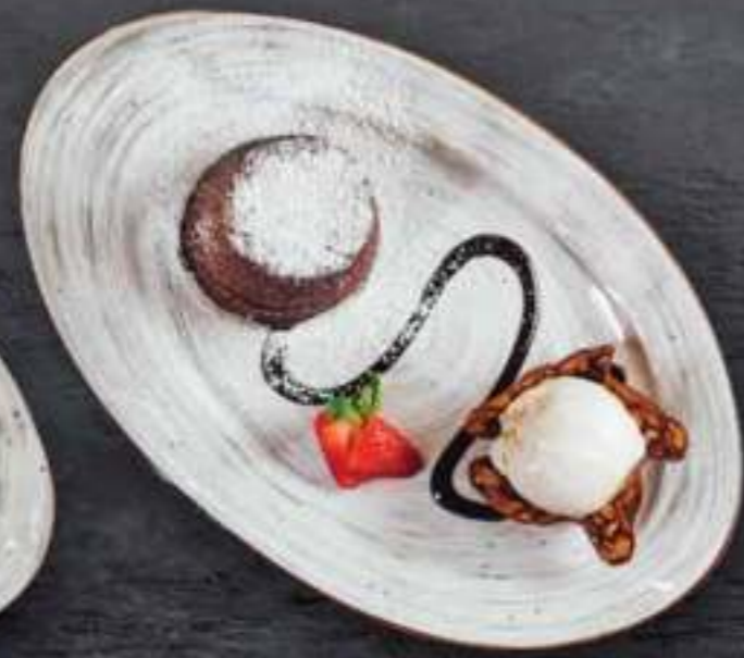
ШОКОЛАДНЫЙ ФОНДАН Chocolate Fondant 580