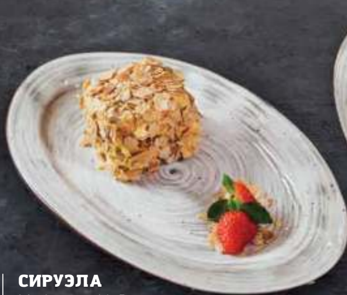
СИРУЭЛА Meringue with Prunes 450