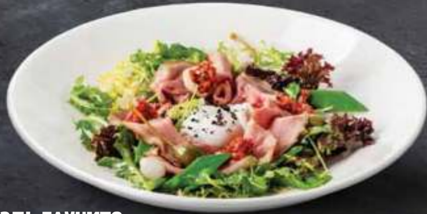
ЭЛЬ ГАУЧИТО El Gauchito salad 790