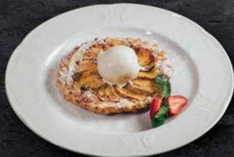
ЯБЛОЧНЫЙ КРАМБЛ Apple crumble 490