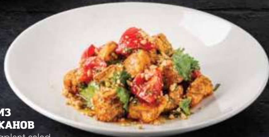
САЛАТ ИЗ БАКЛАЖАНОВ Crispy eggplant salad 560