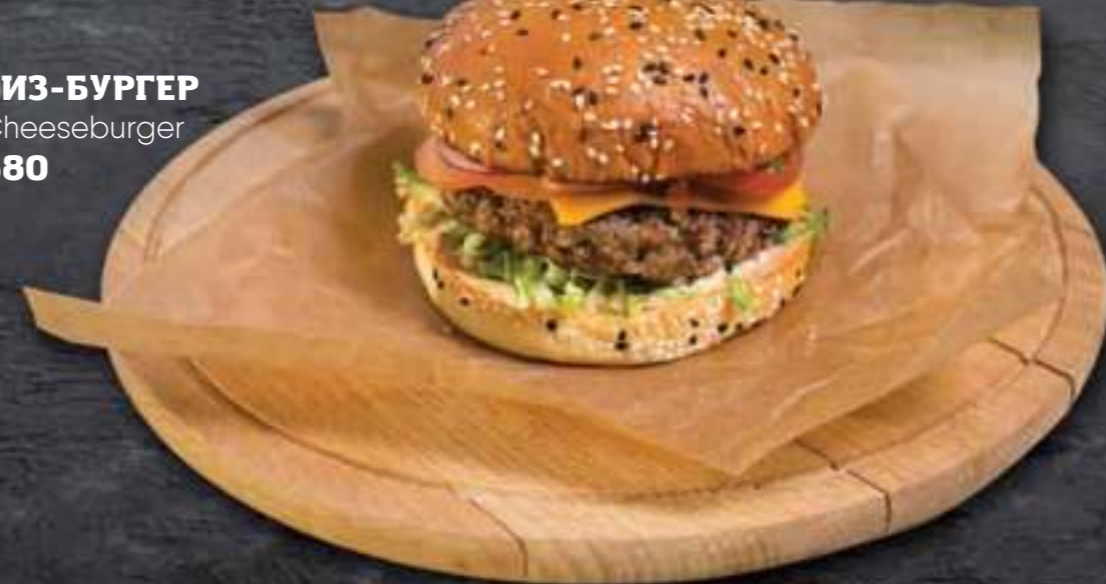
ЧИЗ-БУРГЕР Cheeseburger 680