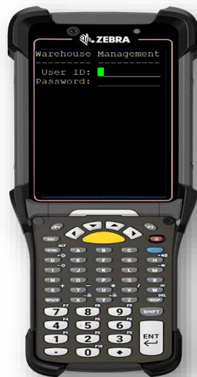
Sistema WMS en Hand Held