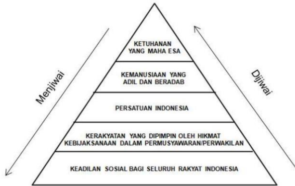
Gambar 1. Sifat Hierarkis-Piramidal Pancasila (Wantanas, 2018)

sila dalam Pancasila saling menjiwai dan dijiwai sebagaimana nampak pada gambar berikut.