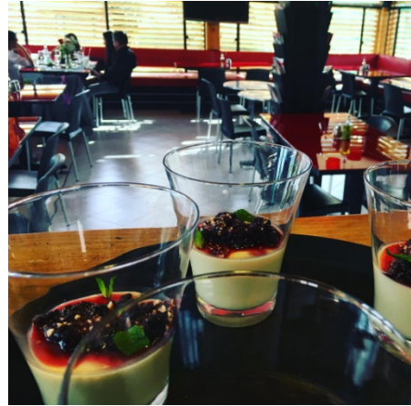
(Panacotta de frutos rojos)