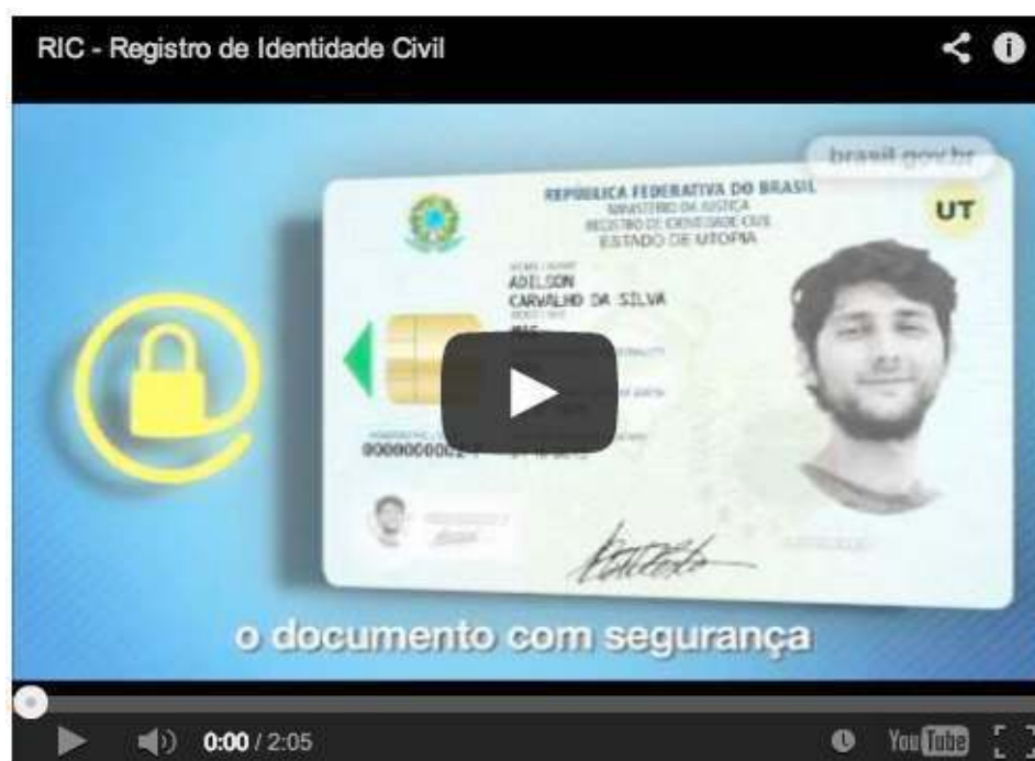
Figura 1 - Imagem de vídeo de explicação das tecnologias e aplicações da RIC

A biometria, por exemplo, associada aos cartões de identificação ( ID-cards ) compostos por chips nos quais estão contidas múltiplas informações sobre seu portador, poderá ser capaz de substituir o labor da memória individual; além de outros tantos mecanismos de recuperação de informações que operam por mediações e que interferem na forma como transitamos pelo espaço público e acessamos seus diferentes lugares, seja de trabalho, de lazer ou mesmo de passagem. O Brasil, por exemplo, já possui um projeto de Registro de Identidade Civil (RIC), nos moldes dos ID-cards , que se encontra em fase de implantação e testes.