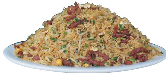
Arroz Frito Lomito