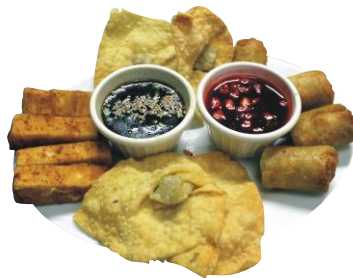
Sampler de Entradas