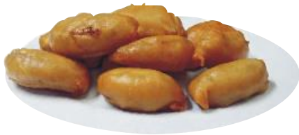
Berenjenas Doradas rellenas de pescado