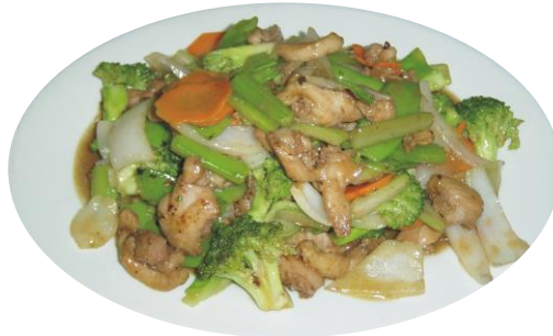
Pollo con Vegetales y salsa soya