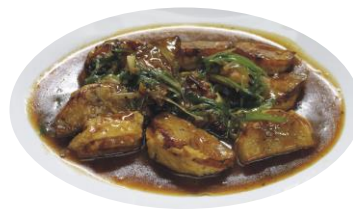
Berenjenas Guisadas rellenas de pescado