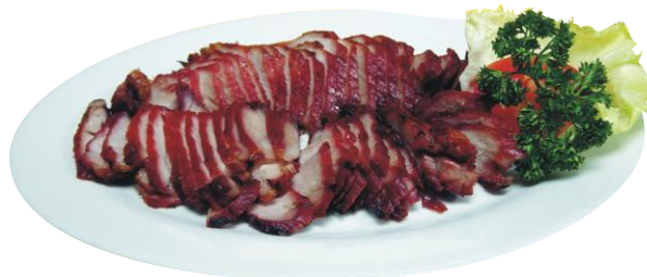
Carne Horneada de cerdo (Cha Siu)