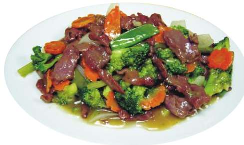
Lomito con Verduras