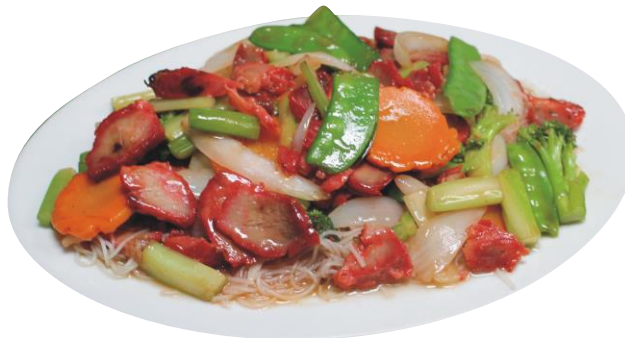
Fideo de Arroz de Cerdo