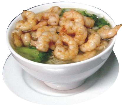
Sopa Mein de Camarón