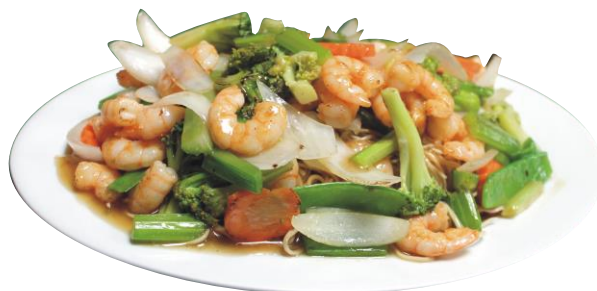
Chow Mein Camarón