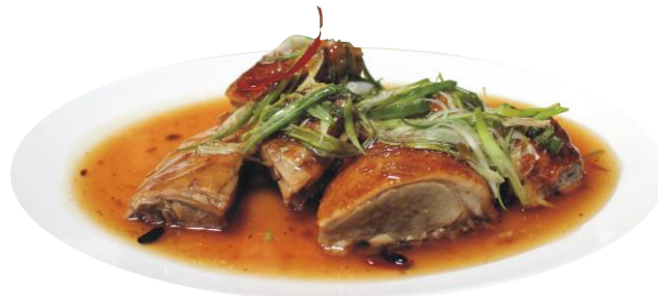
Pato con salsa de Ciruela