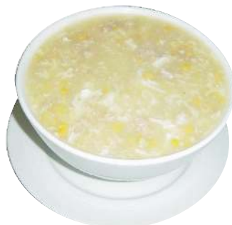
Crema de Elote