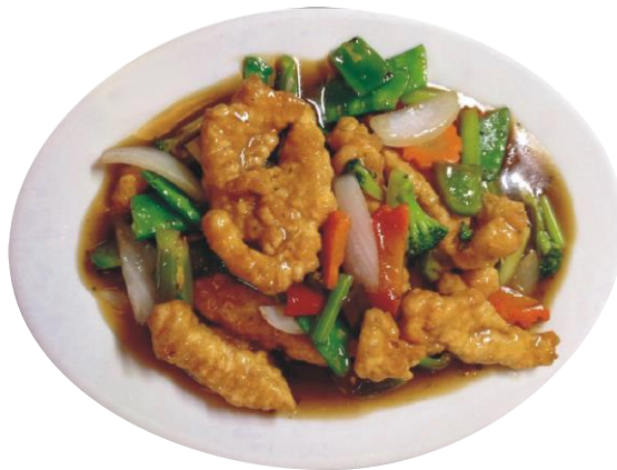
Filete de Pescado con Verduras