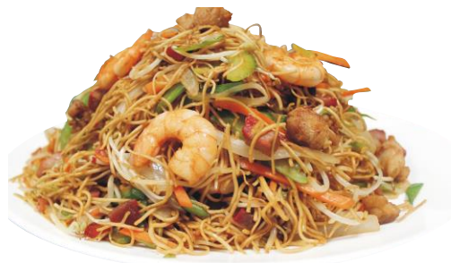
Lo Mein Mixto