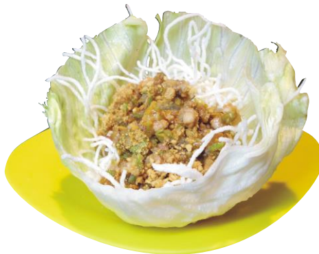
Wrap de San Choy Pau Mixto