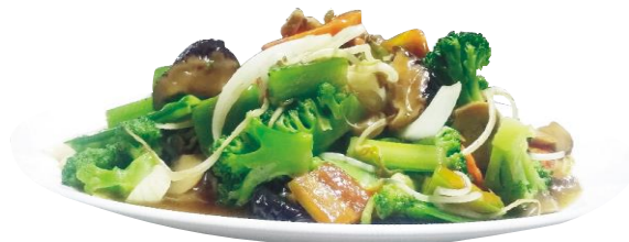
Chow Mein Vegetariano