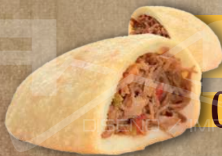
Carne Mechada con queso Carne Mechada

Elaboradas con Harina de Maíz ( libres de Gluten ) son fritas y exquisitas.