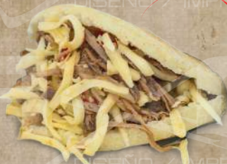
Arepa de carne-queso: (Mezcla perfecta entre carne mechada premium y queso seleccionado).