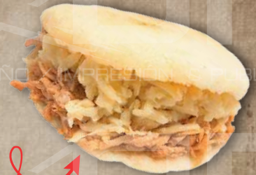
Arepa de Pollo: (Rellena con jugosa pechuga de pollo mechada).