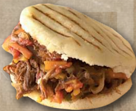
Arepa de Carne: (Rellena con carne mechada premium).