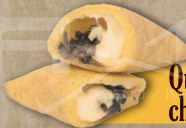
Queso con champiñones