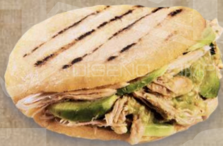
Arepa Reina Pepiada: (Rellena con pollo palta y mayo)

De textura suave y sabor exquisito, son elaboradas con harina de Maíz (Libres de Gluten) y sazonadas con ingredientes 100% naturales. Su cocción es a la plancha