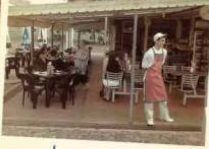
2005 | A Parada foi fundada nestes anos.