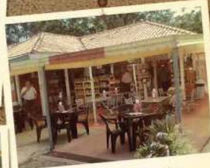
A Parada começa a conquistar seus primeiros clientes.