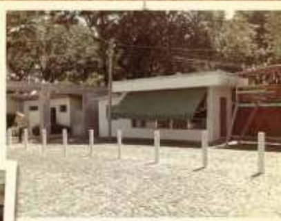
1990 | Tudo começou aqui!