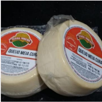
Queijo meia cura R$22