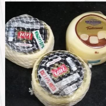
Queijo trufado de palmito R$32