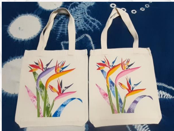
Eco Bag 32x36 e 35x36 R$50