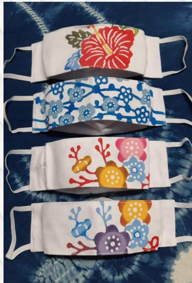
Máscaras de Tecido R$25