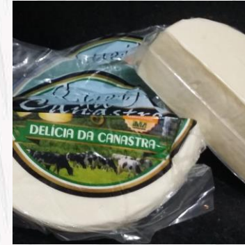
Queijo canastra fresco R$20