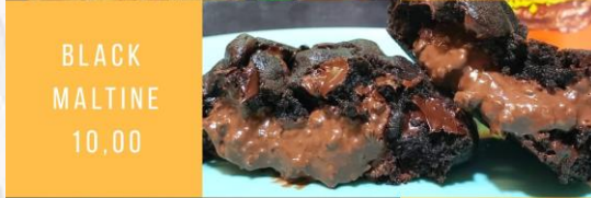
BLACK MALTINE 10,00