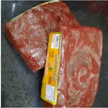
Goiabada Cascão R$12