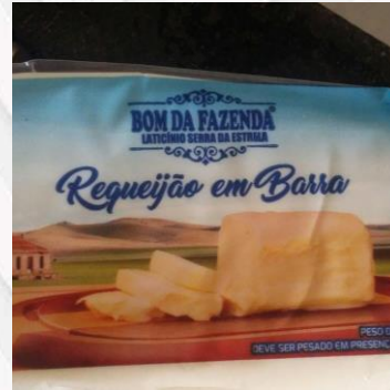
Requeijão em barra R$25