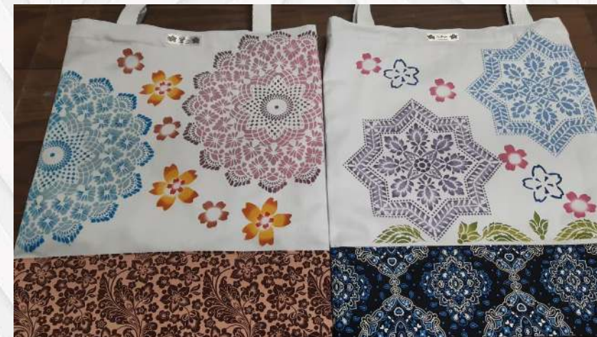
Eco Bag 34x39 R$65

* Estampas podem mudar, consultar disponibilidade