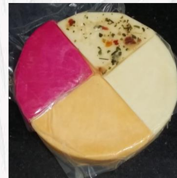
Queijo napolitano R$30