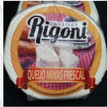
Queijo fresco R$32