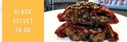
BLACK VELVET 10,00