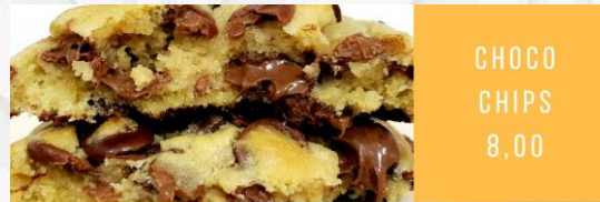
CHOCO CHIPS 8,00