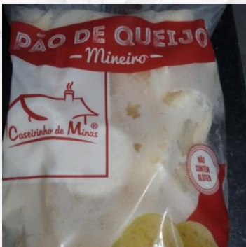
Pão de queijo congelado R$25