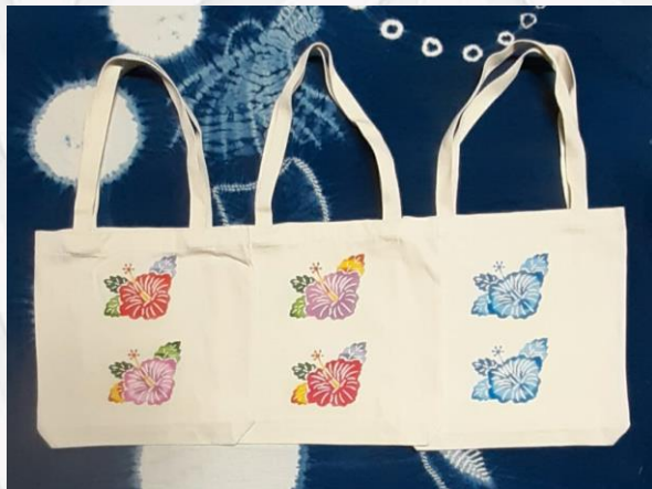
Eco Bag 32x36 e 35x36 R$50