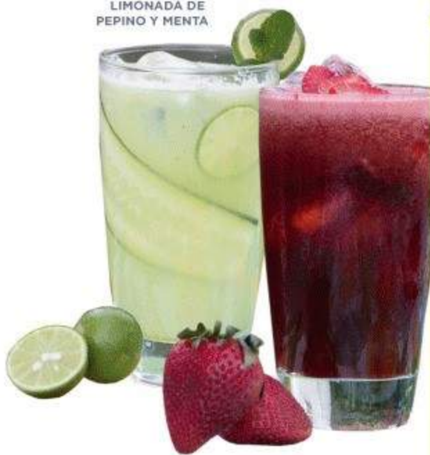
JAMAICA CON FRESA