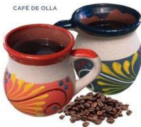
CAFÉ DE OLLA