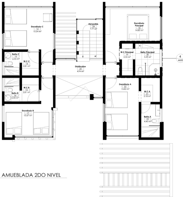
1 PLANTA ARQ. AMUEBLADA 2DO NIVEL 1 : 60