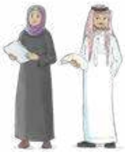
المهتمون بالتعليم بشكل عام