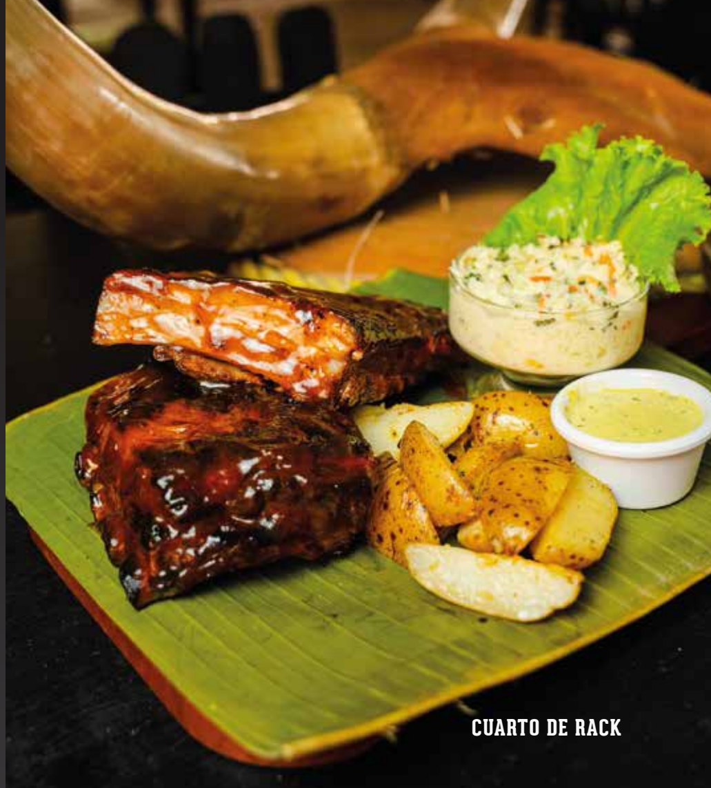
CUARTO DE RACK