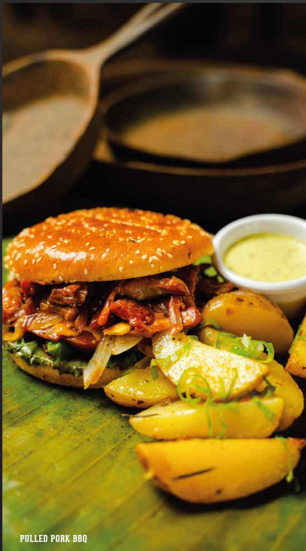
PULLED PORK BBQ

Pechuga de pollo empanizada bañada en queso americano, cebolla fresca, lechuga y tomate, con nuestro aderezo especial de la casa.