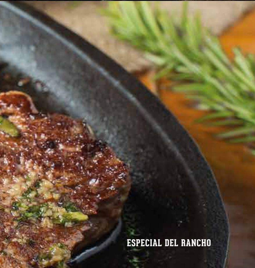
ESPECIAL DEL RANCHO