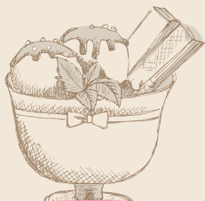
Copa de Helado Doble