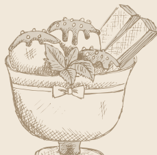
Copa de Helado Triple