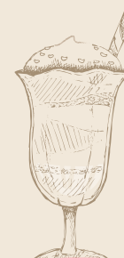
Copa de Café Helado