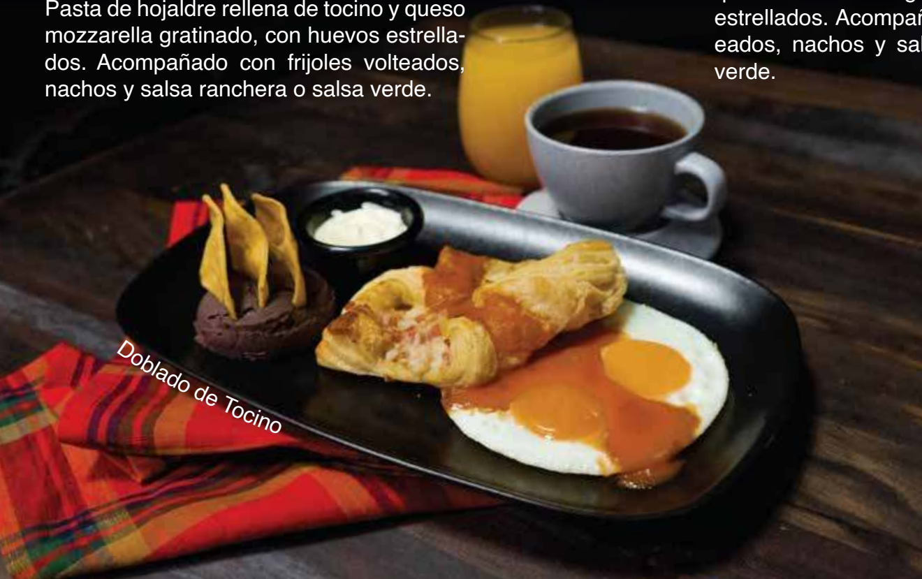
Doblado de Tocino

Doblado de Tocino Q.49. 00 Pasta de hojaldre rellena de tocino y queso mozzarella gratinado, con huevos estrellados. Acompañado con frijoles volteados, nachos y salsa ranchera o salsa verde.